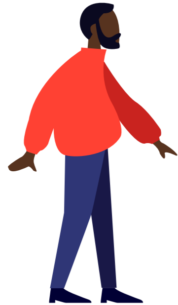
ARRIVÉE DE L'USAGER EN MDM.